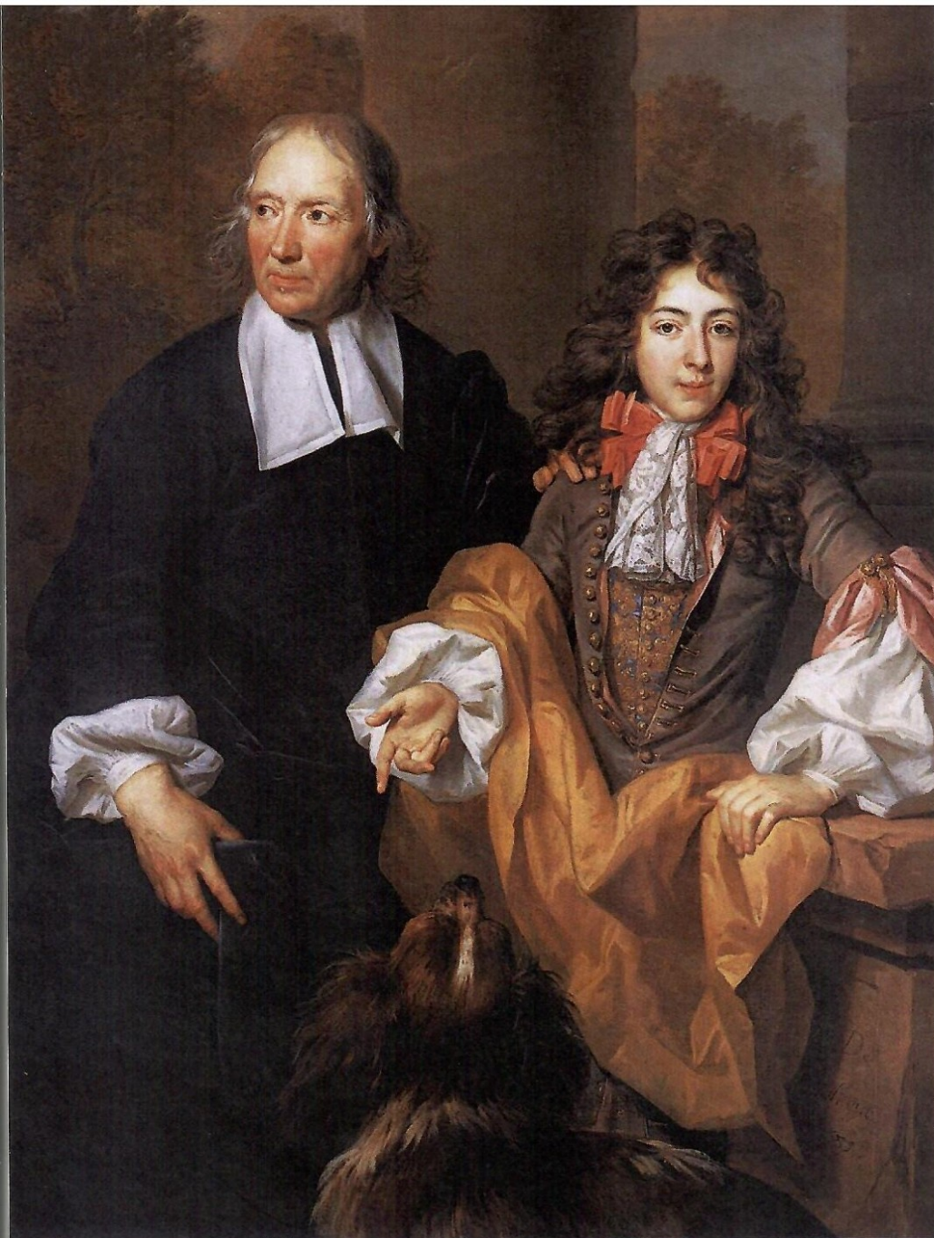
De meester en zijn leerling volgens Nicolas de Largillière (1656-1746).

“In de ontmoetingen met zijn meester ontdekt de weesjongen niet alleen zijn existentiële identiteit – ‘ja, ik besta!’ – maar ook zijn oorspronkelijke integriteit. Een wonder volgt: Renaat komt weer helemaal tot leven. Alles wat in hem naar doodgaan rook – zoals zijn vertrouwen, zijn humor, zijn talenten, zijn ziel – begint geruisloos te verrijzen. De naam Renaat mag je dus gerust beschouwen als ‘hij die werkelijk is herboren!’ Iets wat we gelukkig vandaag ook zien: mensen die na een aanzienlijke portie lijden niet blijven liggen, maar weer opstaan, en genereus een zegen of een engel voor anderen worden.”